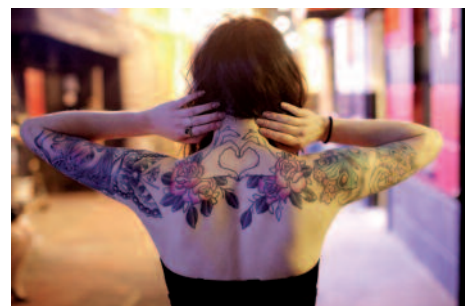
9. El Wood.