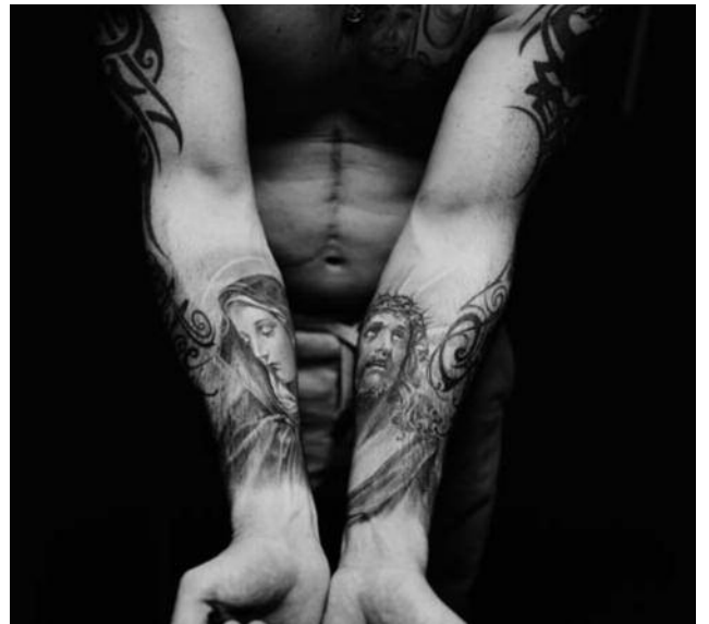
6. Christophe © Julien Lachaussée/ MkF éditions