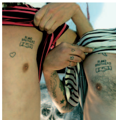
8. Pedro & Thomas Winter.