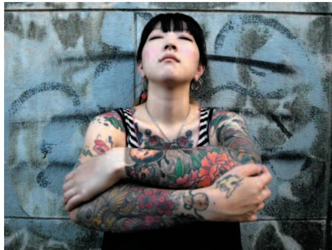
2. Kyon. © C. Coppola/ MkF éditions