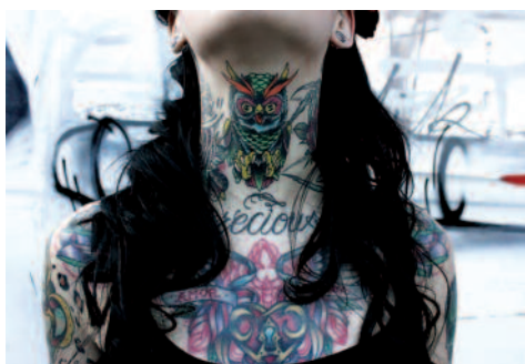
7. Femke.