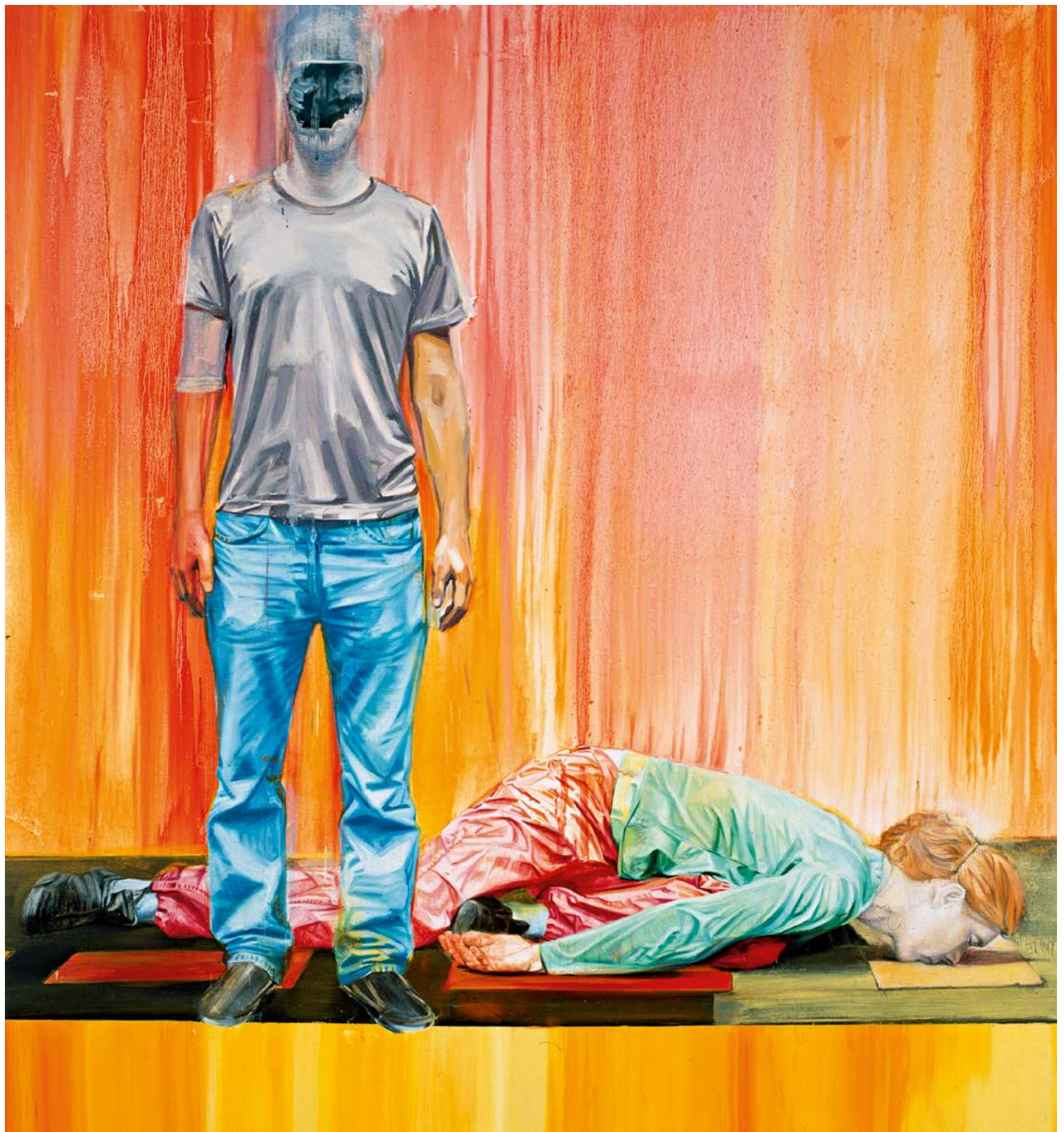
À la verticale , 2010 Huile sur toile, 215 x 195 cm