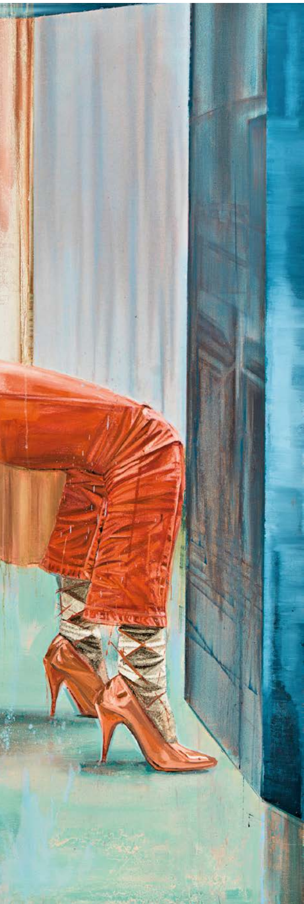
Piéta , 2011 Huile sur toile, 215 x 185 cm